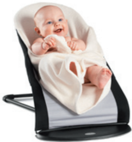
Funda blanda para la Hamaca