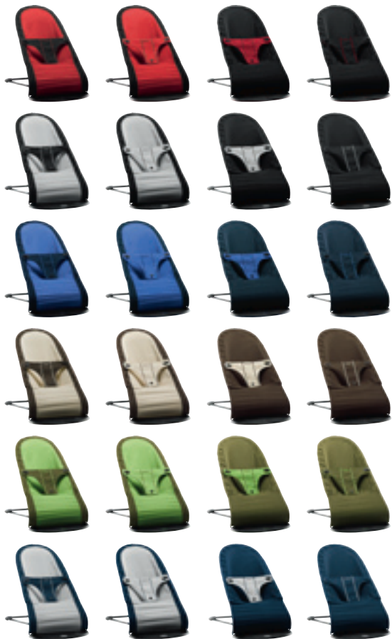
Tejido reversible con cuatro diseños en uno.